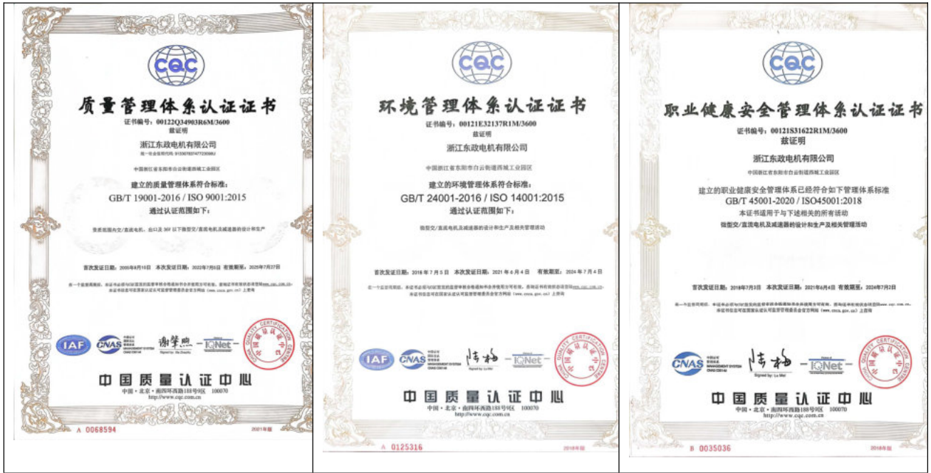
质量管理体系认证