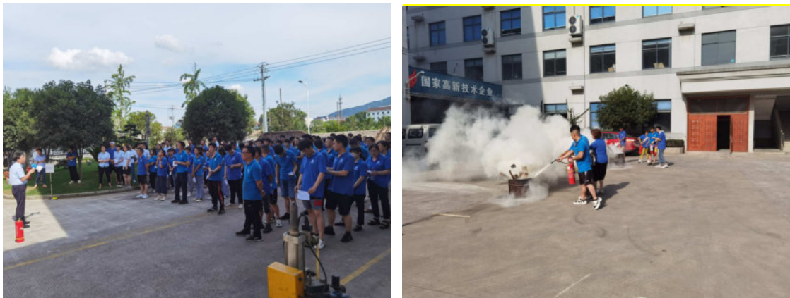
图 6.3-01 公司应急演练现场

公司每年举行消防演练和各种灾害应急演练。公司制订了《危险源辨识/风险评价和风险控制程序》、突发环境事件应急预案等，对火灾、触电、台风、中暑等均有相应的应急措施，并成立了应急指挥部和办公室。