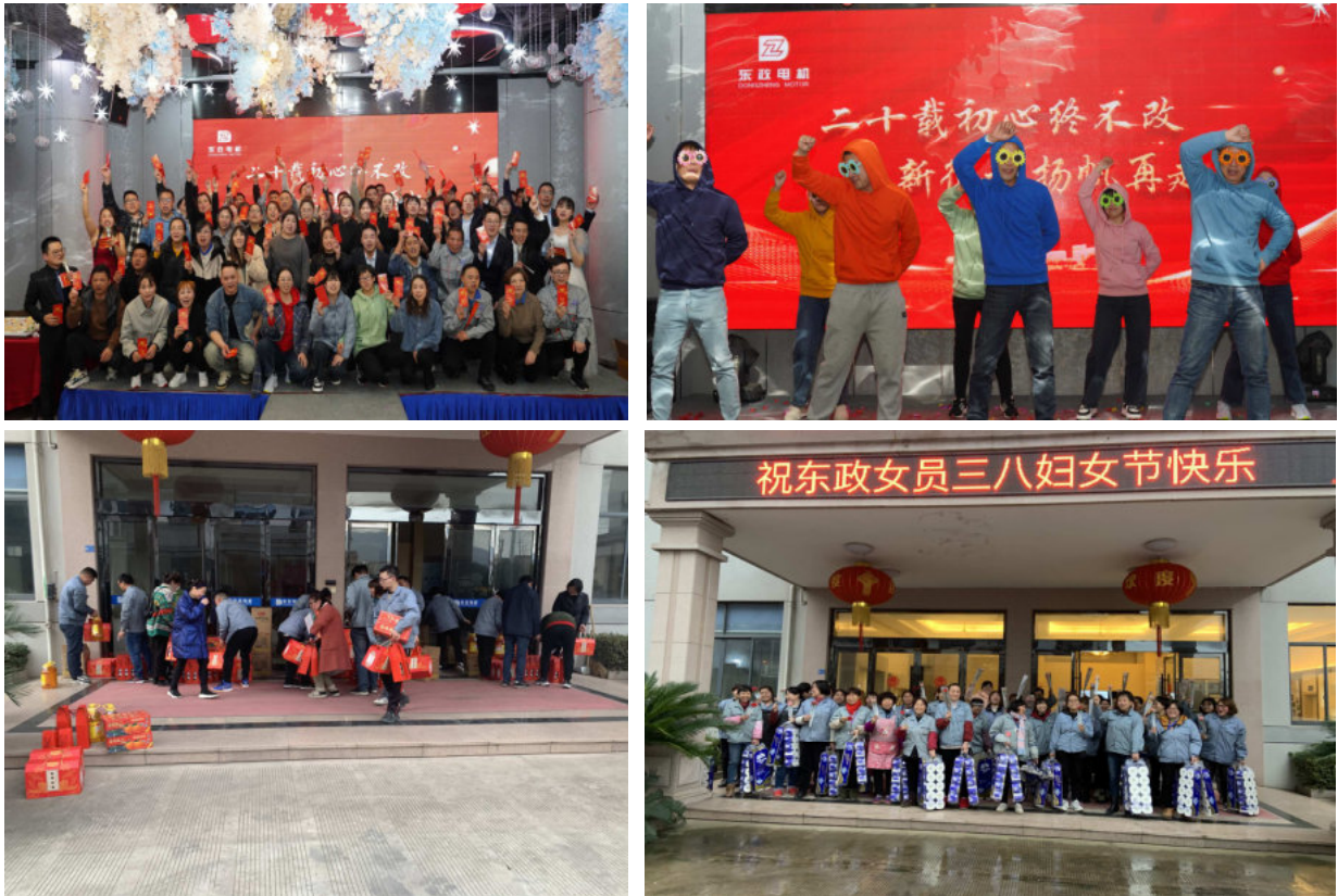
图 3.2-2 丰富多彩的文化活动

公司将东政的价值观、战略目标及业务战略编制成《公司章程》，使之成为公司每位员工必须知晓和遵守的“公司宪法”，涵盖了公司宗旨、基本经营政策、基本组织政策、基本人力资源政策、基本管理控制政策等内容。本着持续改进、民主决策的理念，《公司章程》每五年修订一次，由公司各层级优秀员工与董事会共同商议讨论并审核通过，确保宪章内容的合理性和实用性，提高企业文化执行力。